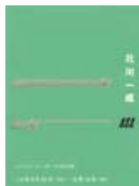
ポスター 「北川一成」 (個展の告知ポスター／cl:ギンザ・グラフィック・ギャラリー、dddギャラリー) 北川一成