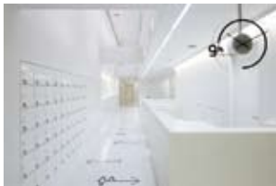
環境・空間 「9h nine hours 京都寺町」 (カプセルホテルのサイン計画／cl:キュービック) 廣村正彰