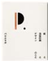
高田 唯 「紙と活版印刷とデザインのこと」 (デザイン書籍のブックデザイン／ cl:ピエ・ブックス) ほか