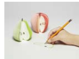
天宅 正 「KUDAMEMO」 (プロダクトブランドの商品／cl:D-BROS) ほか