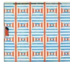
ブック・エディトリアル 「ロトチェンコ+ステパーノワ ロシア 構成主義のまなざし」(展覧会図録／cl:朝日新聞社) 服部一成