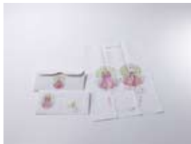
ジェネラルグラフィック 「12Letters」 (プロダクトブランドの商品／cl:ディー・ブロス) 渡邊良重