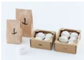
パッケージ 「三木田りんご園」 (りんご農園の包装紙・パッケージ／cl:三木田りんご園) 鎌田順也